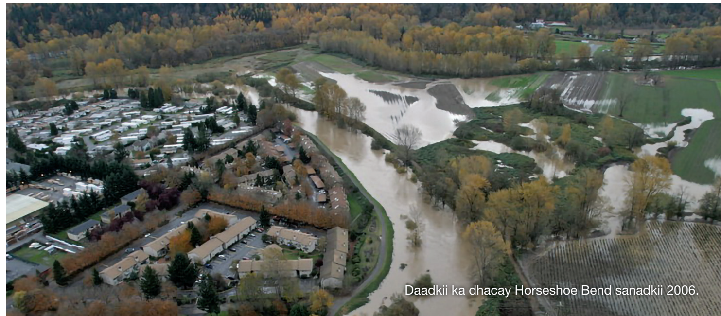
Daadkii ka dhacay Horseshoe Bend sanadkii 2006.

Daadka ayaa khatarta gelinaaya kudhawaad 14,600 guryaha la dagan yahay ah, 42,200 shaqo, bakhaaro, beero, jardiinoyin, iyo goobaha dabiiciga a oo ilaaliya salmon ka sii dabar go'aaya.