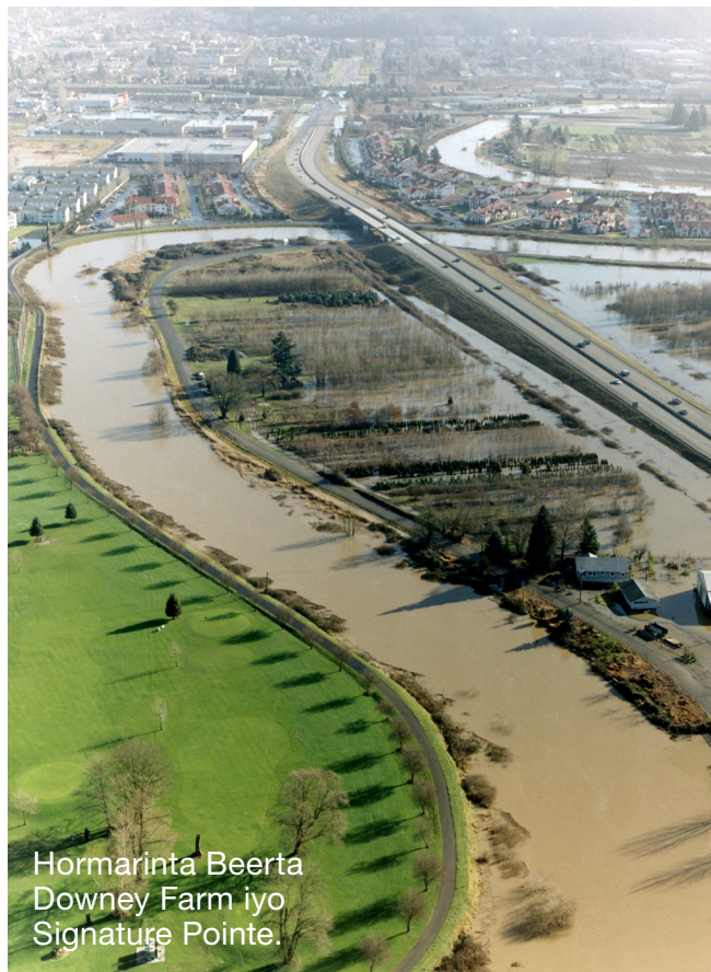
Hormarinta Beerta Downey Farm iyo Signature Pointe.