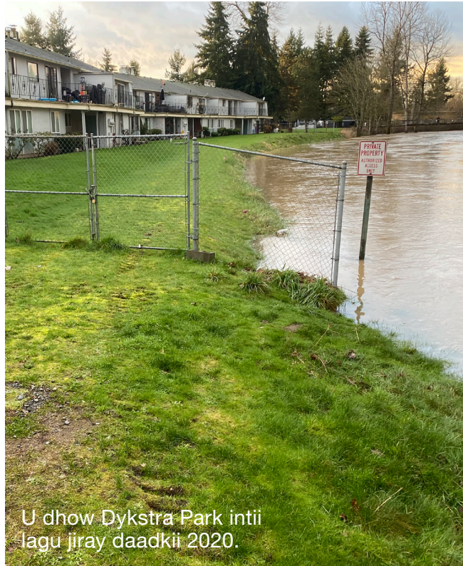
U dhow Dykstra Park intii lagu jiray daadkii 2020.

Marinka mashruuca waxaa ku jira ku dhawaad 21 mayl oo Wabiga Green ah iyo dhulka ku xeeran ayna ku jiraan qaybo kamid ah Auburn, Kent, Renton, SeaTac, Tukwila, iyo deegaannada miyiga ee Degmada King.