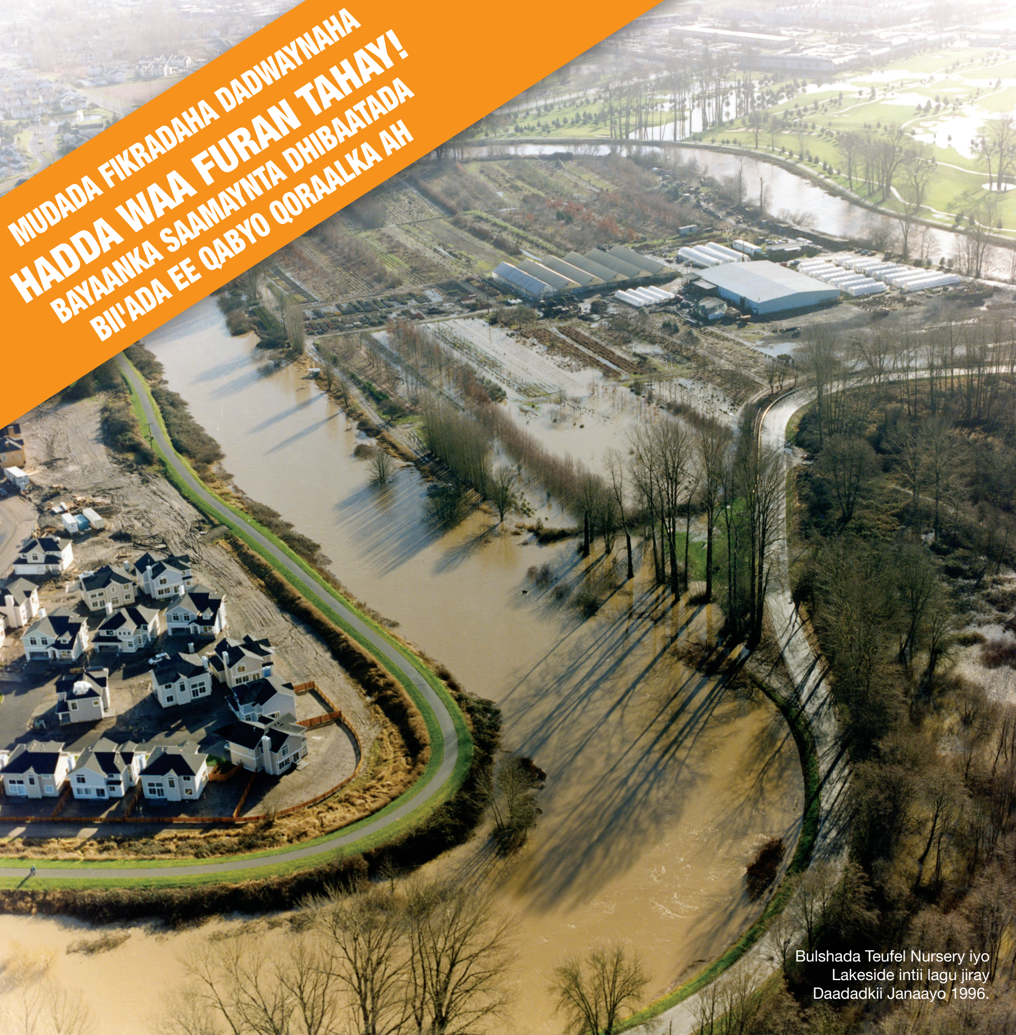
Bulshada Teufel Nursery iyo Lakeside intii lagu jiray Daadadkii Janaayo 1996.

MUDADA FIKRADAHA DADWAYNAHA HADDA WAA FURAN TAHAY! BAYAANKA SAAMAYNTA DHIBAATADA BII'ADA EE QABYO QORAALKA AH